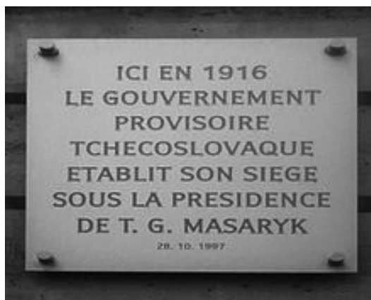
Pamětní deska na domě na Rue Bonaparte v Paříži připomínající ustanovení Československé národní rady v roce 1918

Odkaz státníka a filozofa Tomáše Garrigue Masaryka má tak pokračování v naší generaci.